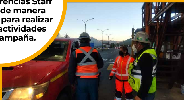
Entrega de volantes y agua