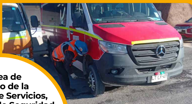
Control de torque

El Área de Tránsito de la Gerencia de Servicios, la Gerencia de Seguridad y los Comités Paritarios de Faena de gerencias Staff trabajaron de manera colaborativa para realizar diferentes actividades para la campaña.