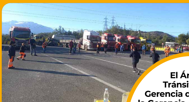
Pausa activa en Maitenes

“Todos los días debemos tener una conducta segura en todo ámbito. Por nuestras familias, por nuestros colegas y nuestro país, tenemos el deber y responsabilidad de una conducta vial impecable”, recalcó.