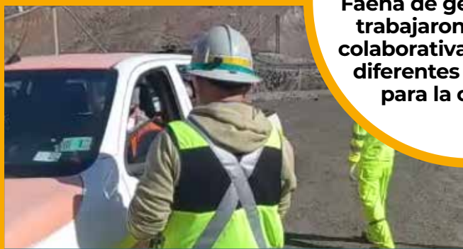
Control documental en terreno

El Área de Tránsito de la Gerencia de Servicios, la Gerencia de Seguridad y los Comités Paritarios de Faena de gerencias Staff trabajaron de manera colaborativa para realizar diferentes actividades para la campaña.